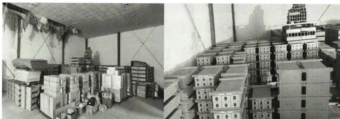
Ảnh hệ thống ắc quy cũ kém phẩm chất